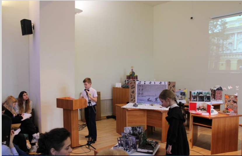
Школы в блокадном Ленинграде