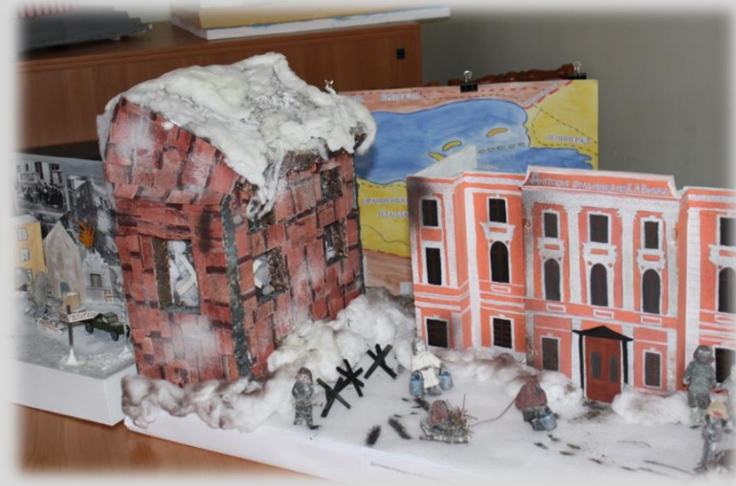
Больницы в блокадном Ленинграде