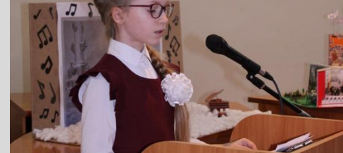
Транспорт блокадного Ленинграда