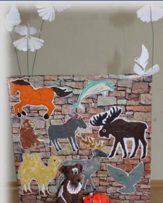
Вклад животных в победу