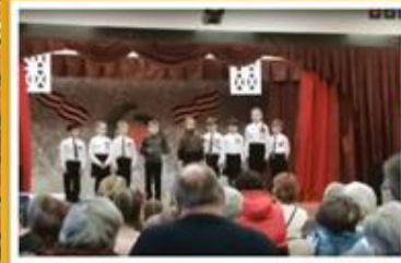
Литературно-музыкальная композиция «Мы помним блокаду»