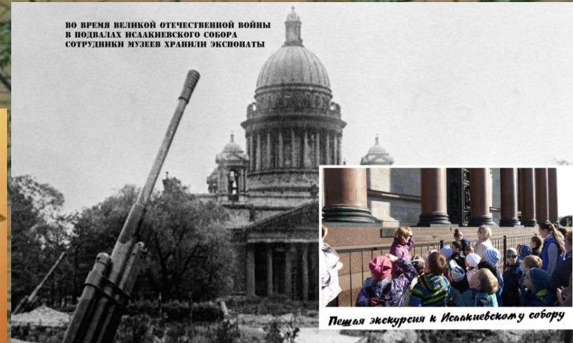
ВО ВРЕМЯ ВЕЛИКОЙ ОТЕЧЕСТВЕННОЙ ВОЙНЫ В ПОДВАЛАХ ИСААКЬЕВСКОГО СОБОРА СОТРУДНИКИ МУЗЕЕВ ХРАНИЛИ ЭКСПОНАТЫ