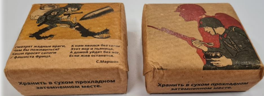
Брикеты горохового супа со стихами С. Маршака на этикетке