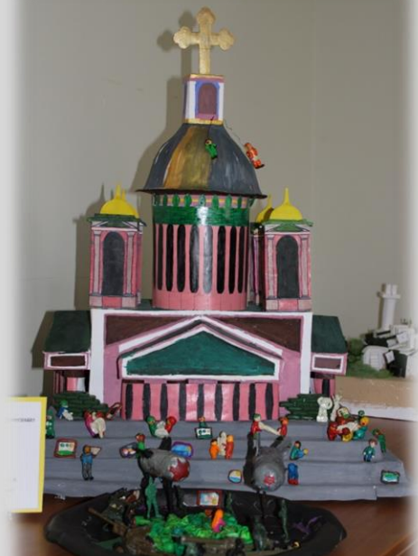
Храмы блокадного Ленинграда