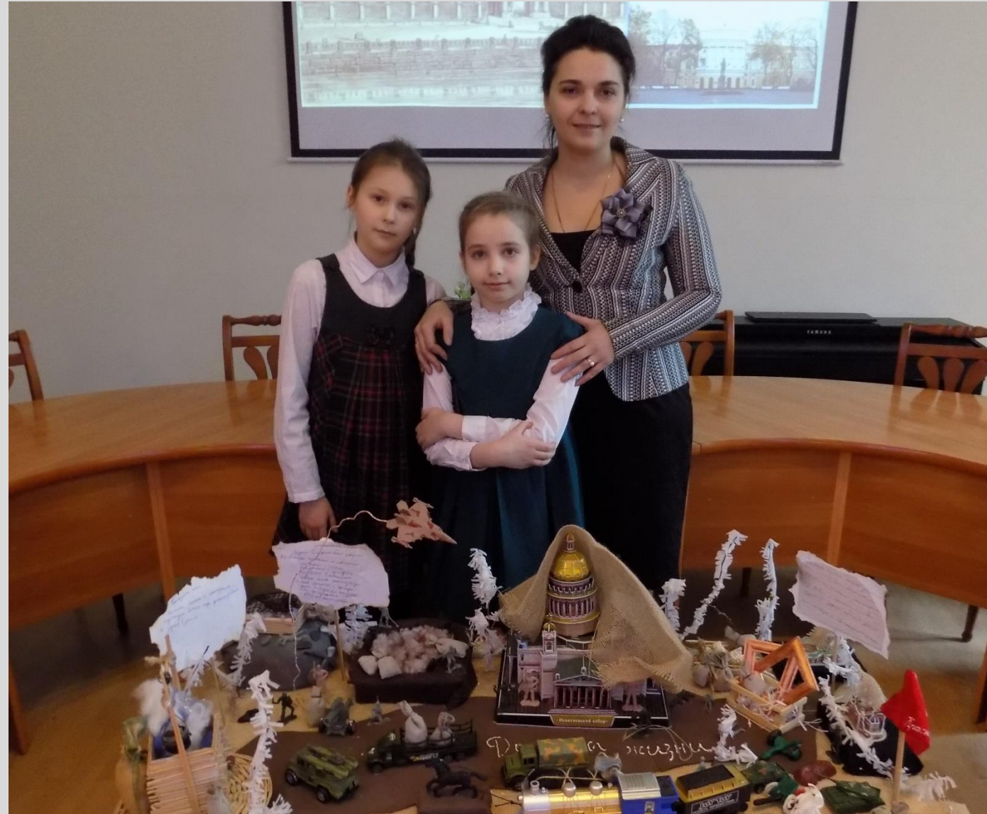
Храмы, музеи, памятники блокадного Ленинграда