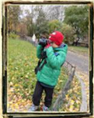
Памятные места Фрунзенского района