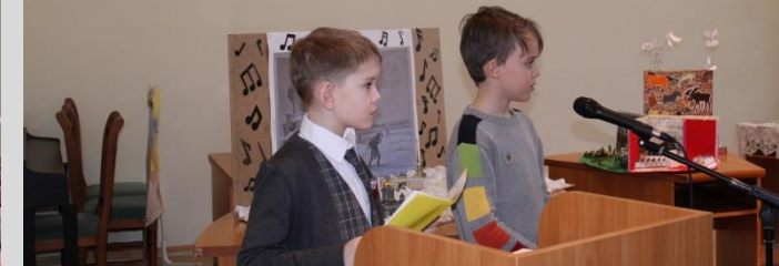
Святыни в блокадном Ленинграде