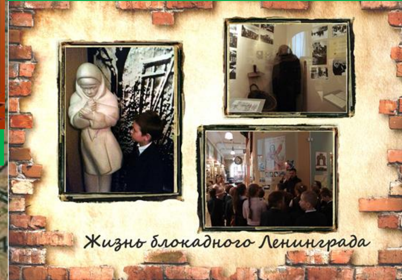
Жизнь блокадного Ленинграда