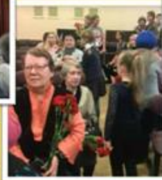
Участие в праздничном концерте и поздравление ветеранов