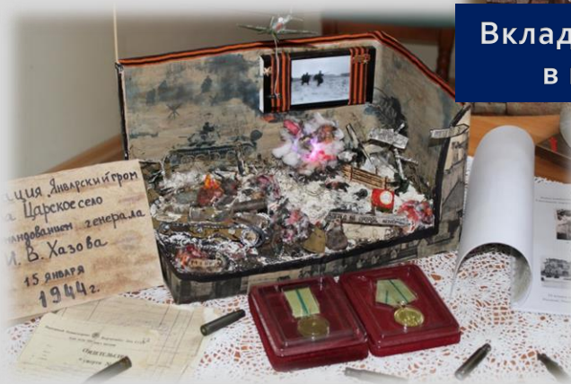
Царское село 1941-1945 г.