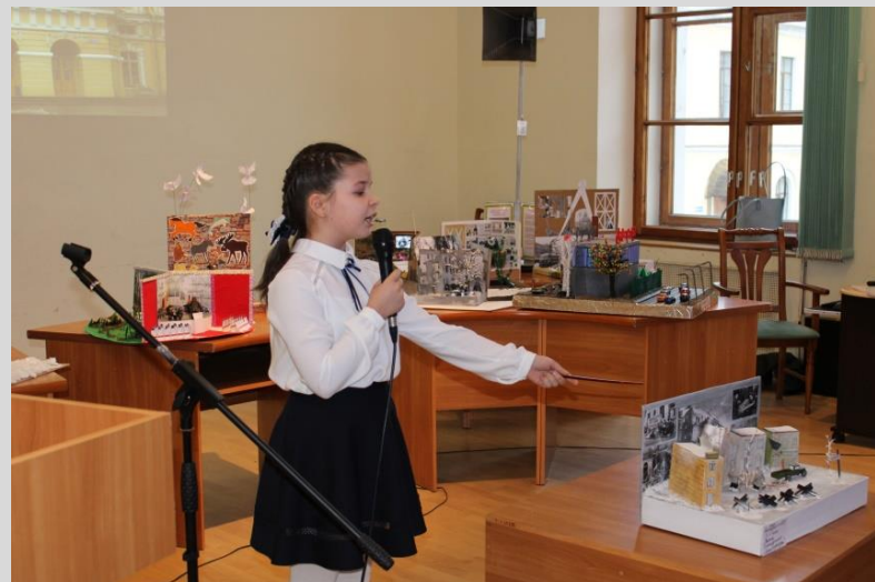
Дети блокадного Ленинграда