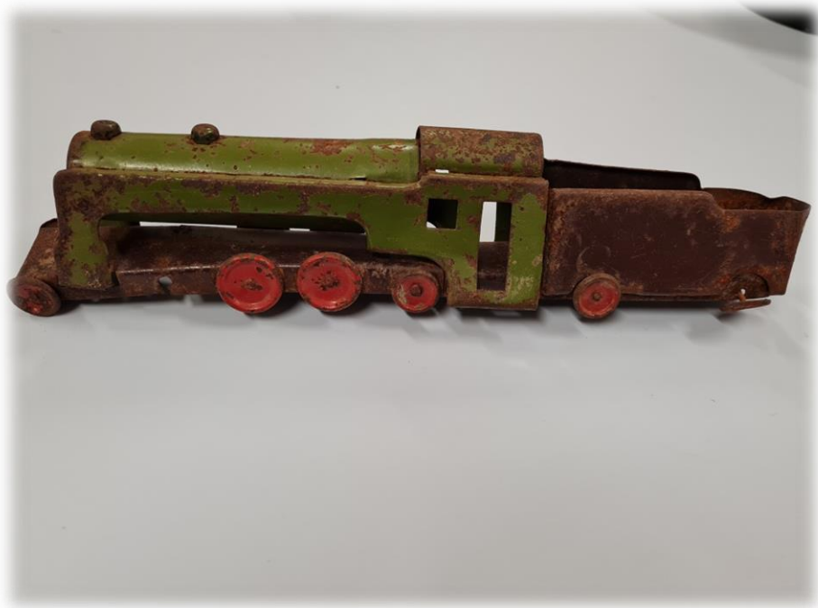
Игрушка «Паровозик» 1930- 1940 г.