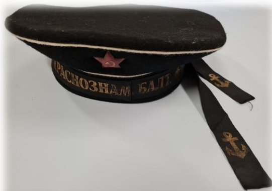
Бескозырка юнги Балтийского флота